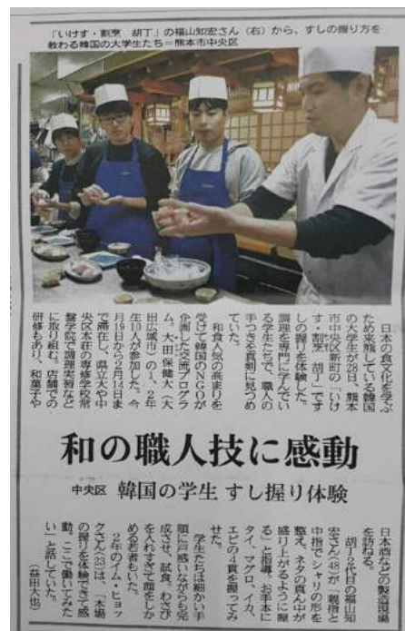
일본 신문에 실린 KJCP 프로그램