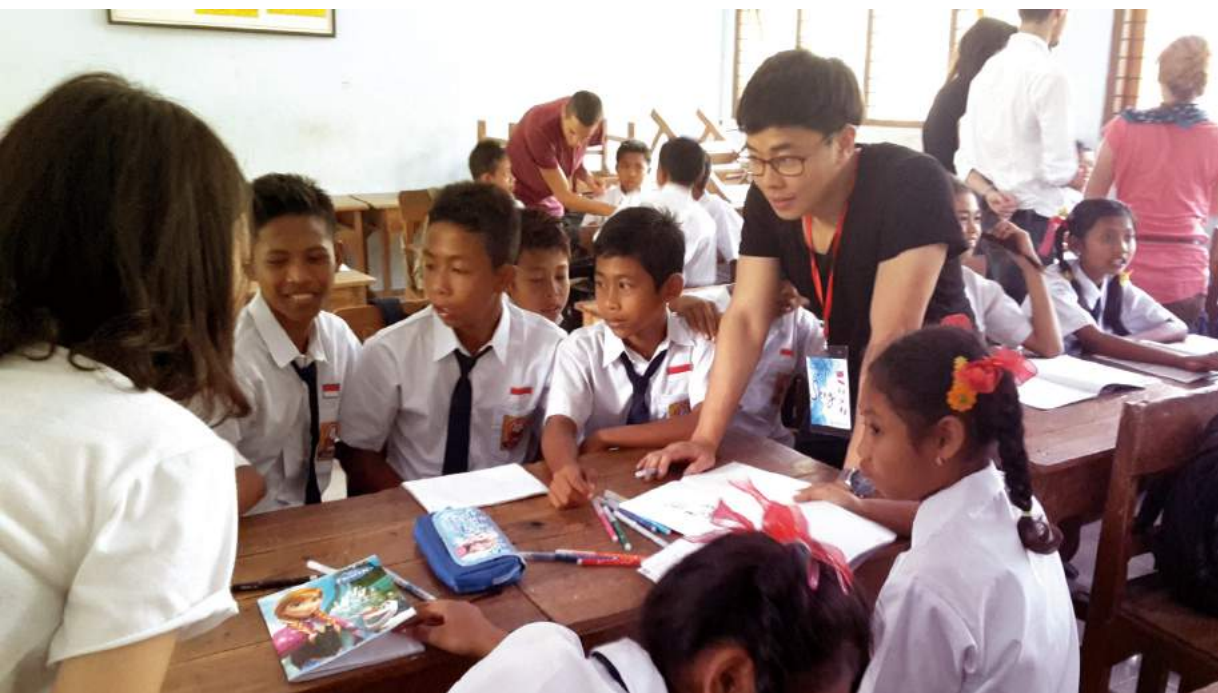
인도네시아 발리 - 초등생교육캠프