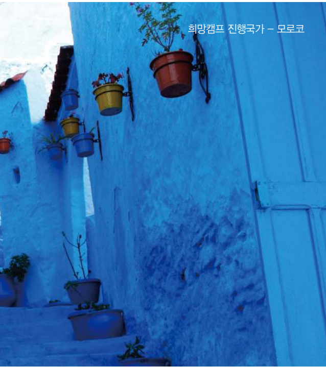
희망캠프 진행국가 - 모로코