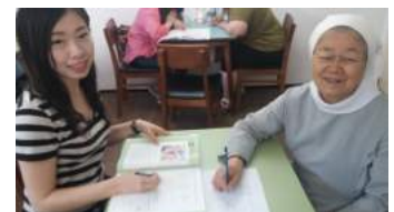
ひろばラウンジの様子