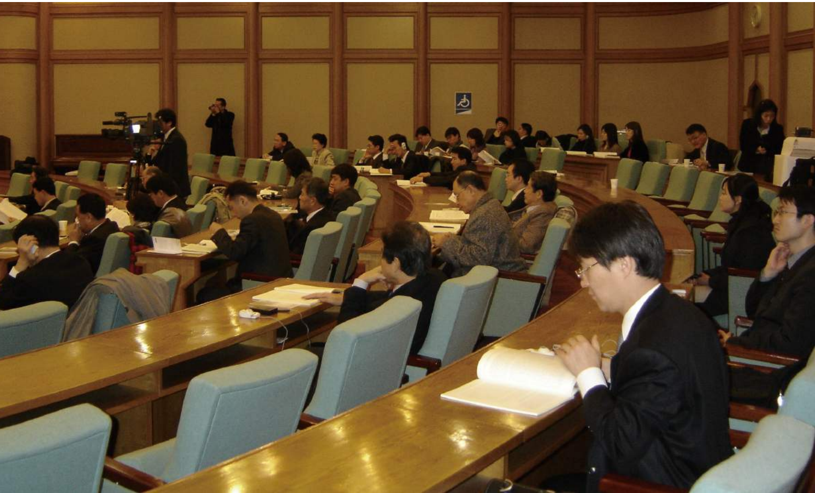
한일국회의원포럼 (한일사회문화포럼 주최)